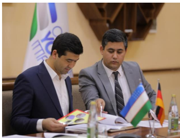
Союз Молодежи Узбекистана - сильный партнер